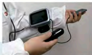
Sonda sectorial de 7 MHz para uso en Bovino y Equino